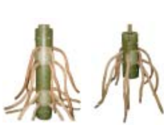
A 型: 1 + 2 相 (中部出线) 安装于变压器相邻两线 圈中间